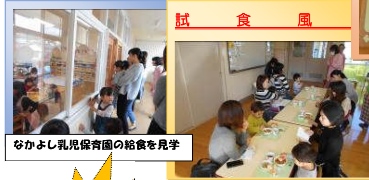
なかよし乳児保育園の給食を見学