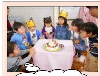
ろうそくの火、消えるかな?