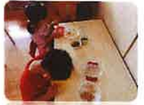
ごはんつぶも つまめるよ!