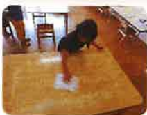
テーブルを拭いて...