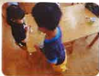
コップとおやつを配って...